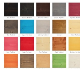
Rubio monocoat olie - kleuren